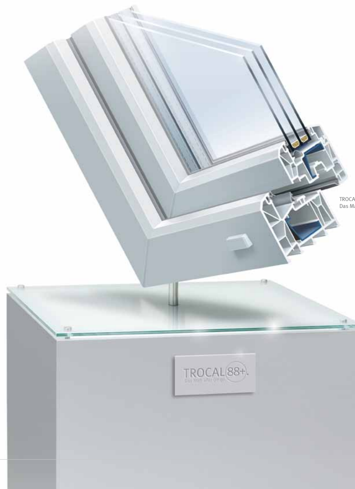
TROCAL 88+. Das Maß aller Dinge.

TROCAL 88+ ist das Maß aller Dinge für hohe Ansprüche und für eine Überlegenheit, die auch durch größere Bautiefen kaum zu übertreffen ist.