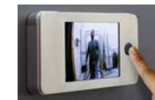
Aufgesetzt für Express

DE-DE - 02/19 Druckfehler, Irrtümer und Technische Änderungen vorbehalten.