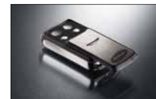
Slider 4-Befehl Handsender