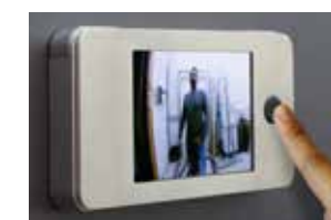
Aufgesetzt für Express

DE-DE - 02/19 Druckfehler, Irrtümer und Technische Änderungen vorbehalten.