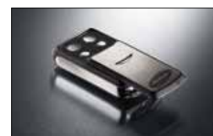
Slider 4-Befehl Handsender