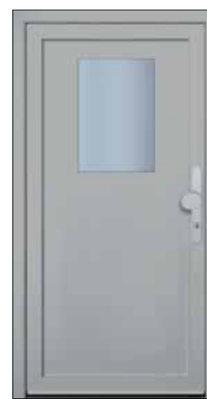
EXPRESS 19 U_d -Wert 1,23 Farbe Weissaluminium Mindestmaß= 900 x 1.900 mm