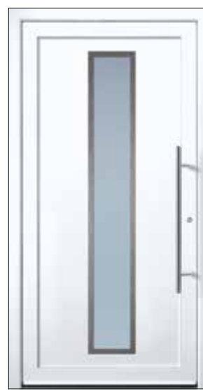
EXPRESS 1 U_d -Wert 1,23 Farbe Verkehrsweiss Mindestmaß= 800 x 1.990 mm

Glas 3-fach Verglasung P4A / WSG außen , Klarglas, Mastercarré oder Satinato weiß mittig, Sicherheitsglas VSG 6 mm innen (Modelle A 16 und A 17 mit Motivverglasung mit klaren Streifen)