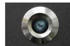
Linse Schutzklasse IP65

+ Keine Aufnahmefunktion Preise auf Anfrage!