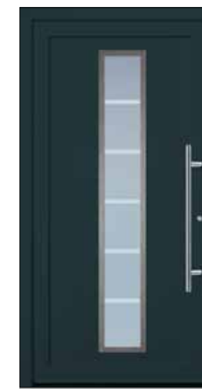
EXPRESS 16 U_d -Wert 1,23 Farbe Anthrazitgrau Mindestmaß= 800 x 1.990 mm