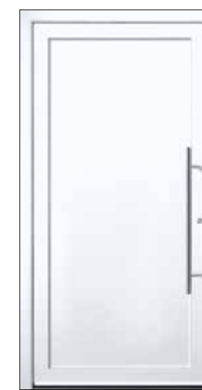
EXPRESS 21 U_d -Wert 1,15 Farbe Verkehrsweiss Mindestmaß= 700 x 1.900 mm