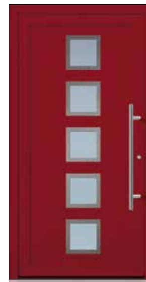
EXPRESS 11 U_d -Wert 1,23 Farbe Weinrot Mindestmaß= 800 x 1.990 mm