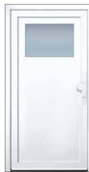
EXPRESS 18 U_d -Wert 1,23 Farbe Verkehrsweiss Mindestmaß= 1.100 x 1.900 mm