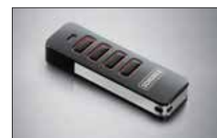
Pearl 4-Befehl Handsender