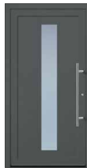
EXPRESS 5 U_d -Wert 1,23 Farbe Effektlack Mindestmaß= 800 x 1.990 mm