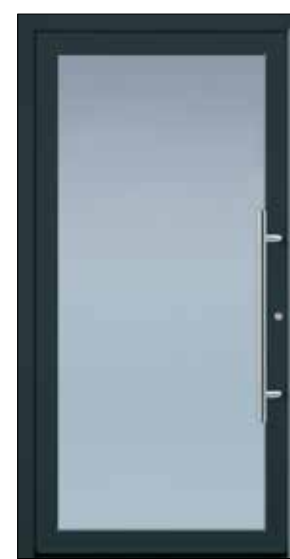
GANZGLASFÜLLUNG EXPRESS 20 U_d -Wert 1,16 Farbe Anthrazitgrau Mindestmaß= 700 x 1.900 mm