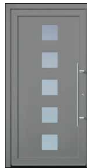
EXPRESS 10 U_d -Wert 1,23 Farbe Graualuminium Mindestmaß= 800 x 1.990 mm